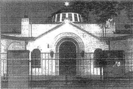
1950 wurde die Feierhalle zur Synagoge umgebaut. Seit der Einweihung der neuen Synagoge am 9.11.2001 dient das Gebäude wieder als Begräbnishalle. Der Davidstern auf dem Dach fand inzwischen ebenfalls in der neuen Synagoge Platz. Es handelt sich dabei um den Originalstern, der einst auf dem Dach der 1938 von den Nazis zerstörten Sempersynagoge angebracht und von einem Feuerwehrmann gerettet worden war.

- Gedenkstein für die Opfer während der Zeit des Nationalsozialis-