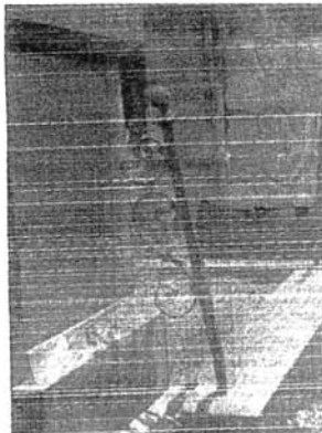
Nur noch kleine Reste der ehemaligen prächtigen Metalleinfassungen der Gräber blieben erhalten. 1943 hatten die Nationalsozialisten angeordnet, sämtliches Metall auf den jüdischen Friedhöfen in Sachsen zu demontieren und der Rüstungsproduktion zuzuführen.

Neben der Dokumentation aller Grabsteine wollen sie auch die Geschichte des Friedhofs erforschen und sitzen dafür in Dresdner Archiven. Ebenso sollen Biographien hier