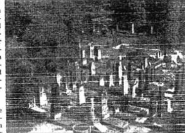
Mehr als 2500 Grabstellen befinden sich auf dem Neuen Israelitischen Friedhof in Dresden

Während der gesamten Zeit von 1933 bis 1945 war der Friedhof in Betrieb, sorgten jüdische Angestellte für die Bestattung auch der Men-