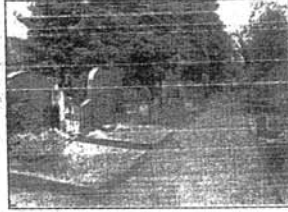
Der Israelitische Friedhof im Jahre 1948 und die gleiche Perspektive im Jahre 2003

die Erforschung der beiden erhaltenen jüdischen Friedhöfe. Von 1999 bis 2001 leitete HATIKVA die aufwändige Dokumentation des ältesten jüdischen Friedhofs Sachsens, der 1751 gegründet worden war und noch sehr gut erhalten ist.